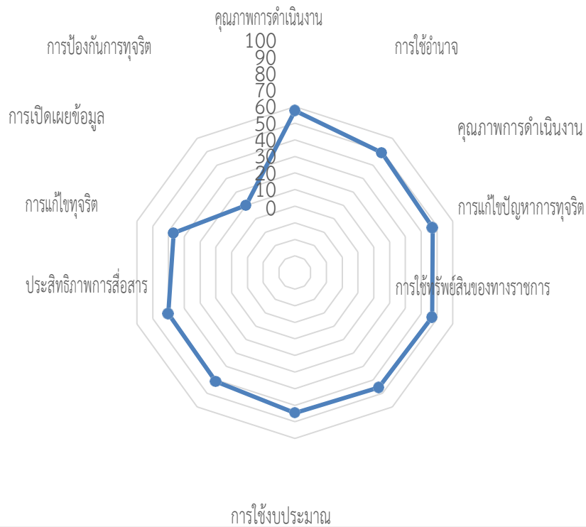
แผนภาพที่ ๒ ผลการประเมินจำแนกรายละเอียดตามตัวชี้วัด

ผลการประเมินจำแนกรายละเอียดตามตัวชี้วัด โรงเรียนบ้านช้างงานเนินทอง ประจำปีงบประมาณ ๒๕๖๕